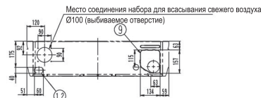
Продольное отверстие для размещения трубок сзади (вид спереди)